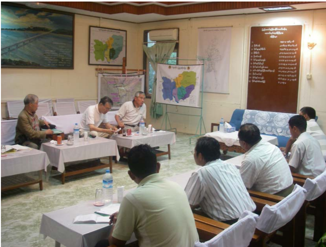
Pyi 地区の管理事務所での現地技術者との意見交換