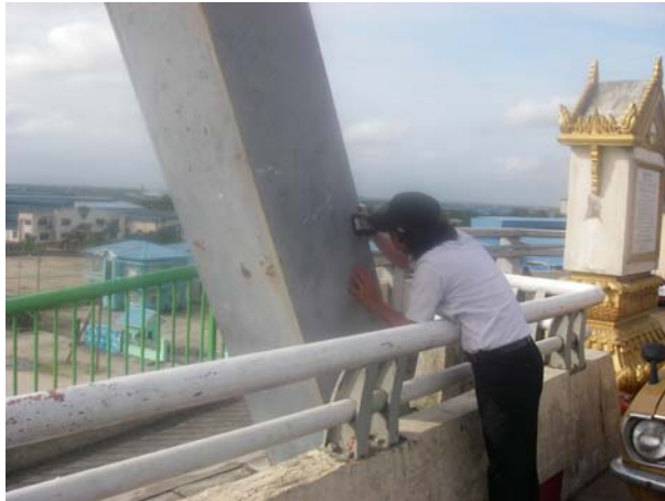
インスペクションゲージによる膜厚測定